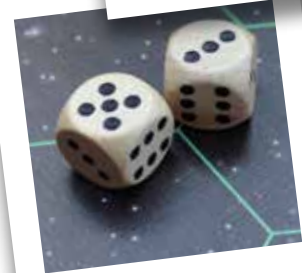
save the date