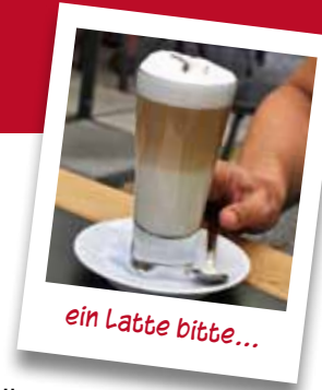
ein Latte bitte...