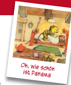
Oh, wie schön ist Panama