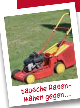
tausche Rasenmähen gegen...